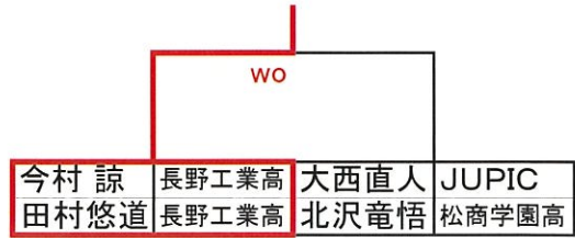
男子ダブルス (3位決定戦)