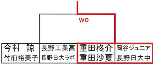
混合ダブルス (3位決定戦)